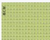
SUNBRELLA Bengali 10107 L140 Code 2580107