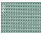
SUNBRELLA Bengali 10105 L140 Code 2580105