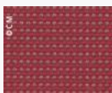
SUNBRELLA Bengali 10110 L140 Code 2580110