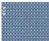
SUNBRELLA Bengali 10104 L140 Code 2580104

SUNBRELLA BENGALI. La matière première est du Sunbrella® Acrylique Teint Masse. Les pigments de couleurs sont mélangés au cœur de la fibre au stade initial de sa fabrication, avant même de produire le fil. Les couleurs Sunbrella® résistent aux agressions du soleil et aux intempéries. Résistant aux UV, Déperlant et anti-tache, Résistant aux moisissures, Protection UV, Respirant, Entretien facile.