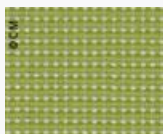
SUNBRELLA Bengali 10106 L140 Code 2580106